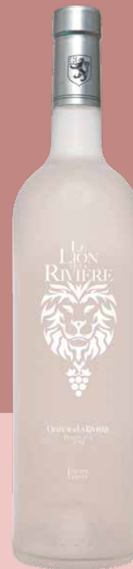
LE LION DE LA RIVIERE